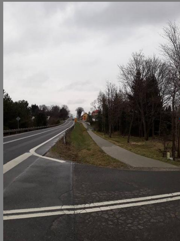
Budowa chodnika w ciągu drogi krajowej 19 w miejscowości Łężany.