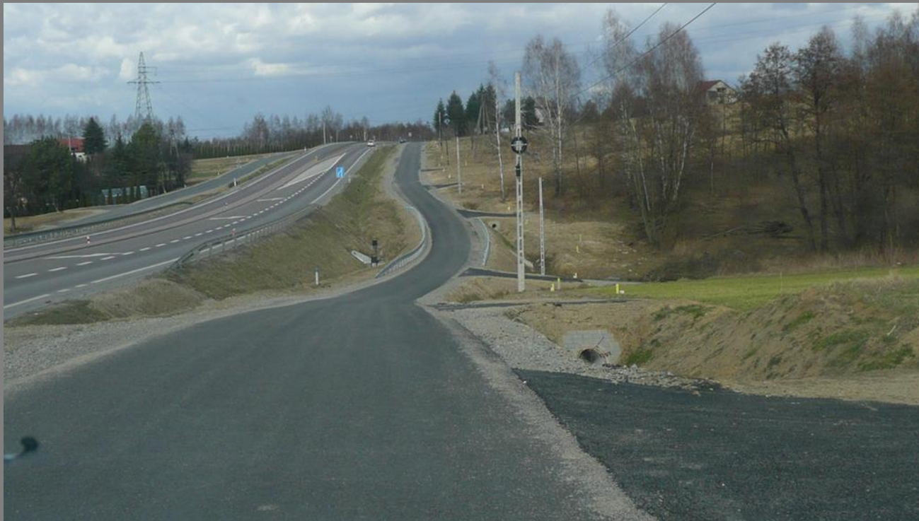
Ciąg pieszo – jezdny w miejscowości Parkosz DK 94