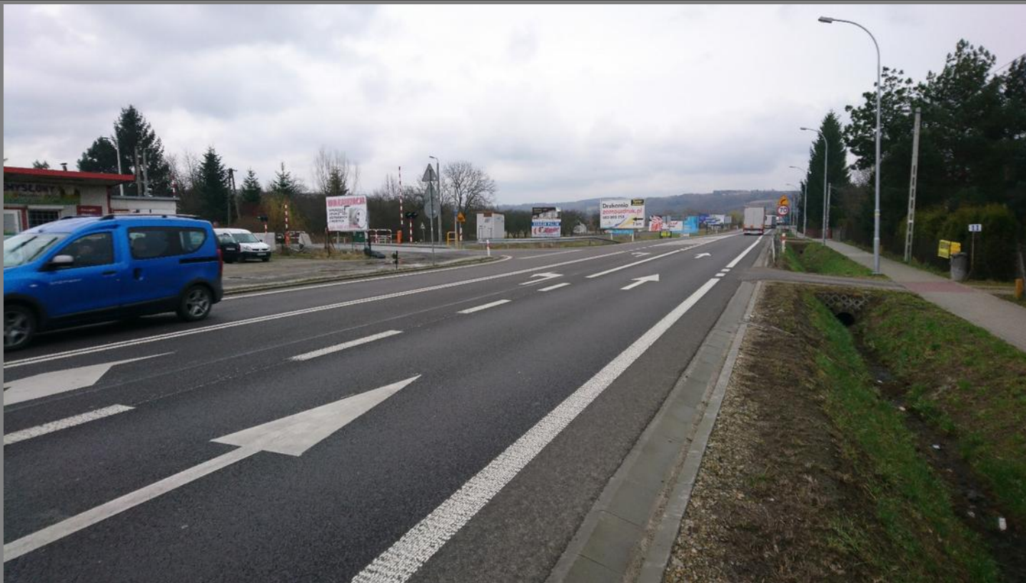
Przebudowa skrzyżowania w ciągu drogi krajowej nr 19 w miejscowości Zarzecze.