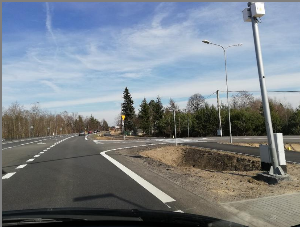
Przebudowa drogi krajowej nr 9 na odcinku Majdan Królewski - Komorów.